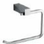
PORTABOLLO Color - Cromado AQ7400-CE