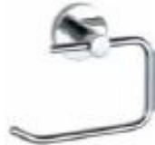
PORTAVELLO Color - Cromado AQ2214-CR