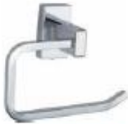
PORTAVELLO Color - Cromado AQ7134-CR