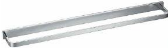
TOALLERO DE BARRA 60cm Color - Cromado AQ/277-CH