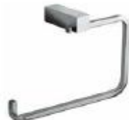
TOALLERO DE APO Color - Cromado AQ7201-CE