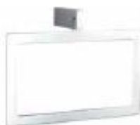
TALLERO DE ASEO Color - Cromado AQ/205-CR