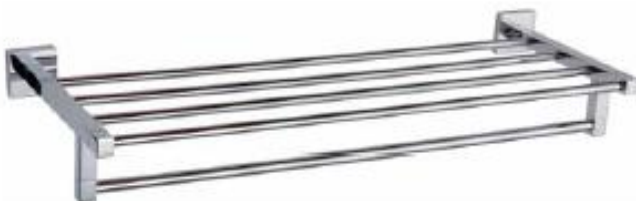
TORCILLERO HOTELERO REPISA Color - Cromado AQ71611-CE