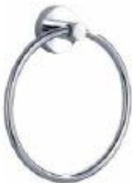
TORILLERO DE ANILLO Color - Cromado AQ2216-CR