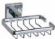
JABONERA Color - Cromado AQ7165-CE