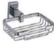
JABONERA Color - Cromado AQ7135-CR