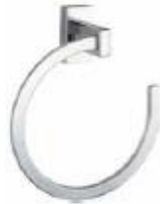
TALLEREO DE ANIL Color - Cromado AQ7136-CR