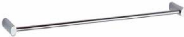
TALLERO DE BARRA 60cm Color - Cromado AQ771-CE