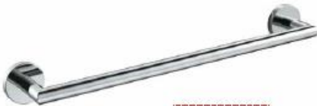
TALLERO DE BARRA 60cm Color - Cromado AQ/1218-CE