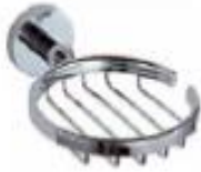
JABONERA Color - Cromado AQ2215-CR