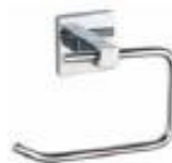
PORTAVARILLO Color - Cromado AQ7164-CE