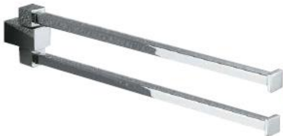
TOALLERO DOBLE GANCHO Color - Cromado AQ7101-CE