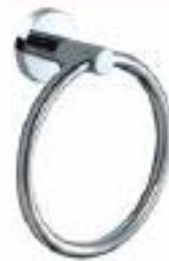
TALLERO DE ANILLO Color - Cromado AQ/3211-CE