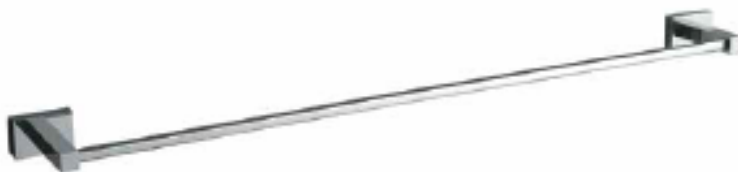
TALLERO DE BARRA 60cm Color - Cromado AQ/71168-CR