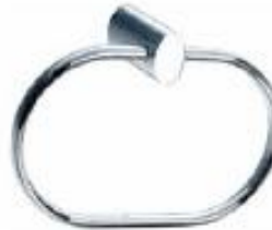
TALLERO DE ANO Color - Cromado AQ776-CE