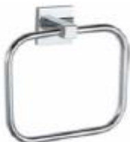
TORCILLERO DE ANILLO Color - Cromado AQ7166-CE