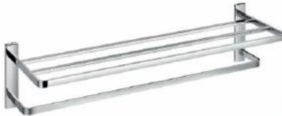
TOALLERO HOTELERO REPSA Color - Cromado AQ/277/11-CH