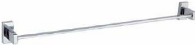
TALLEREO DE BARRAS Color - Cromado AQ7137-CR