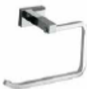
PORTAROLLO Color - Cromado AQ/4164-CR