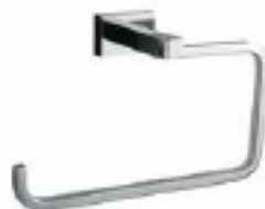
TALLERO DE ARO Color - Cromado AQ/73163-CR