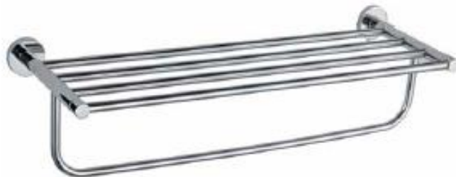
TORILLERO HOTELERO REPSA Color - Cromado AQ22111-CR