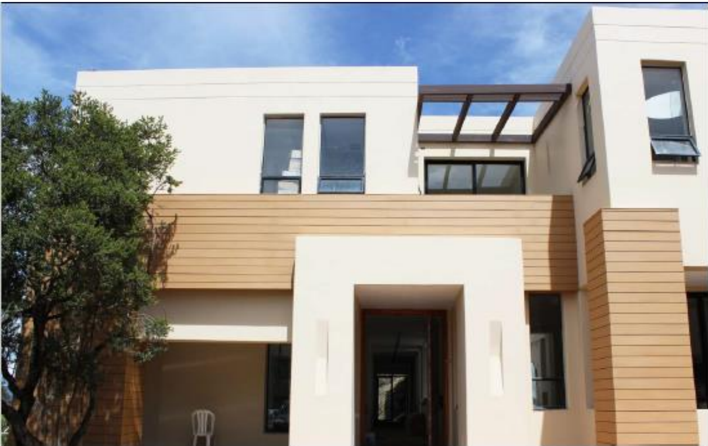
Referencia: WALLBOARD STAR WOOD, Color: Camel Proyecto: Torca, Lugar: Bogotá