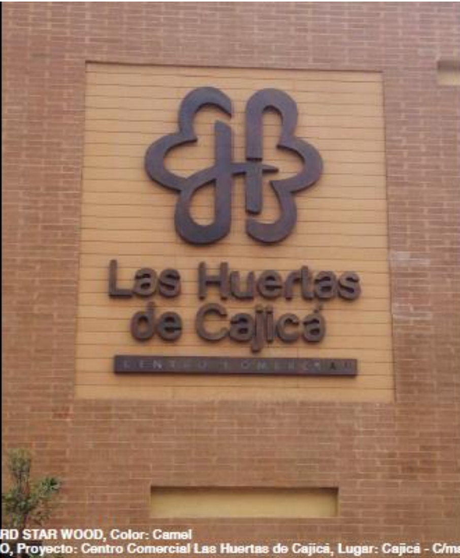
Referencia: WALLBOARD STAR WOOD, Color: Camel Constructora: AMARILO, Proyecto: Centro Comercial Las Huertas de Cajicá, Lugar: Cajicá - C/marca