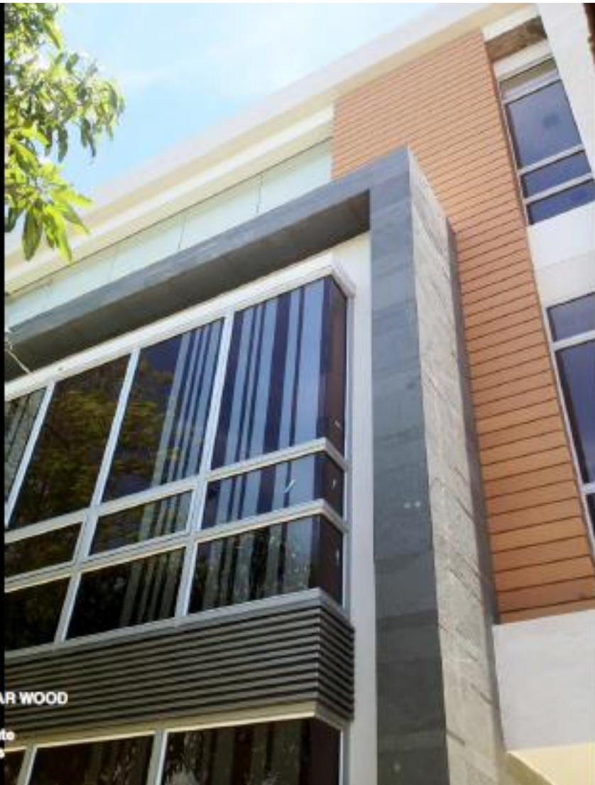
Referencia: WALLBOARD STAR WOOD Color: Camel Cliente: Arq. Javier Bustamante Proyecto: Centrales Eléctricas Lugar: Cúcuta