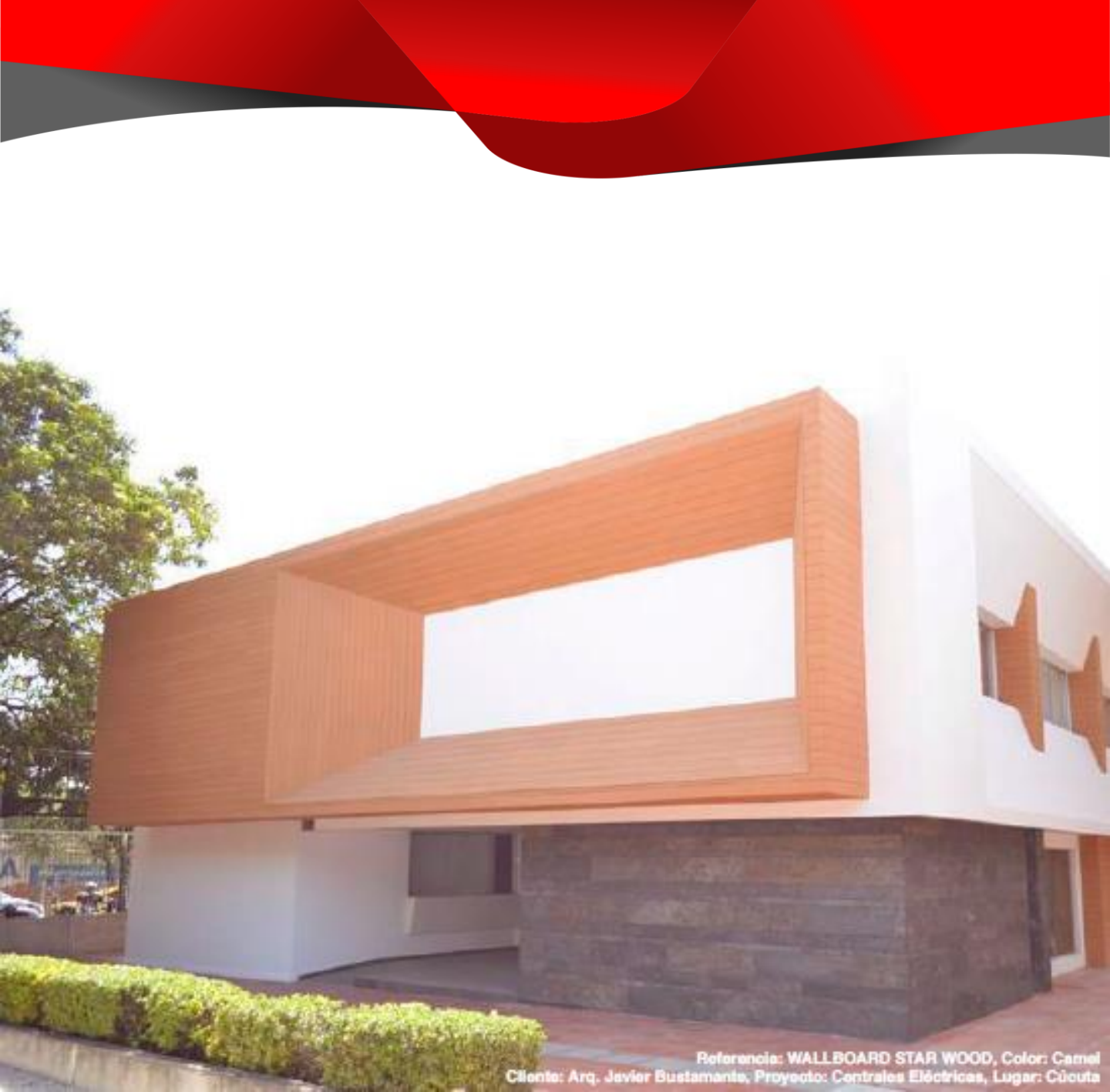
Referencia: WALLBOARD STAR WOOD, Color: Carnel Cliente: Arq. Javier Bustamante, Proyecto: Contrales Eléctricas, Lugar: Cúcuta