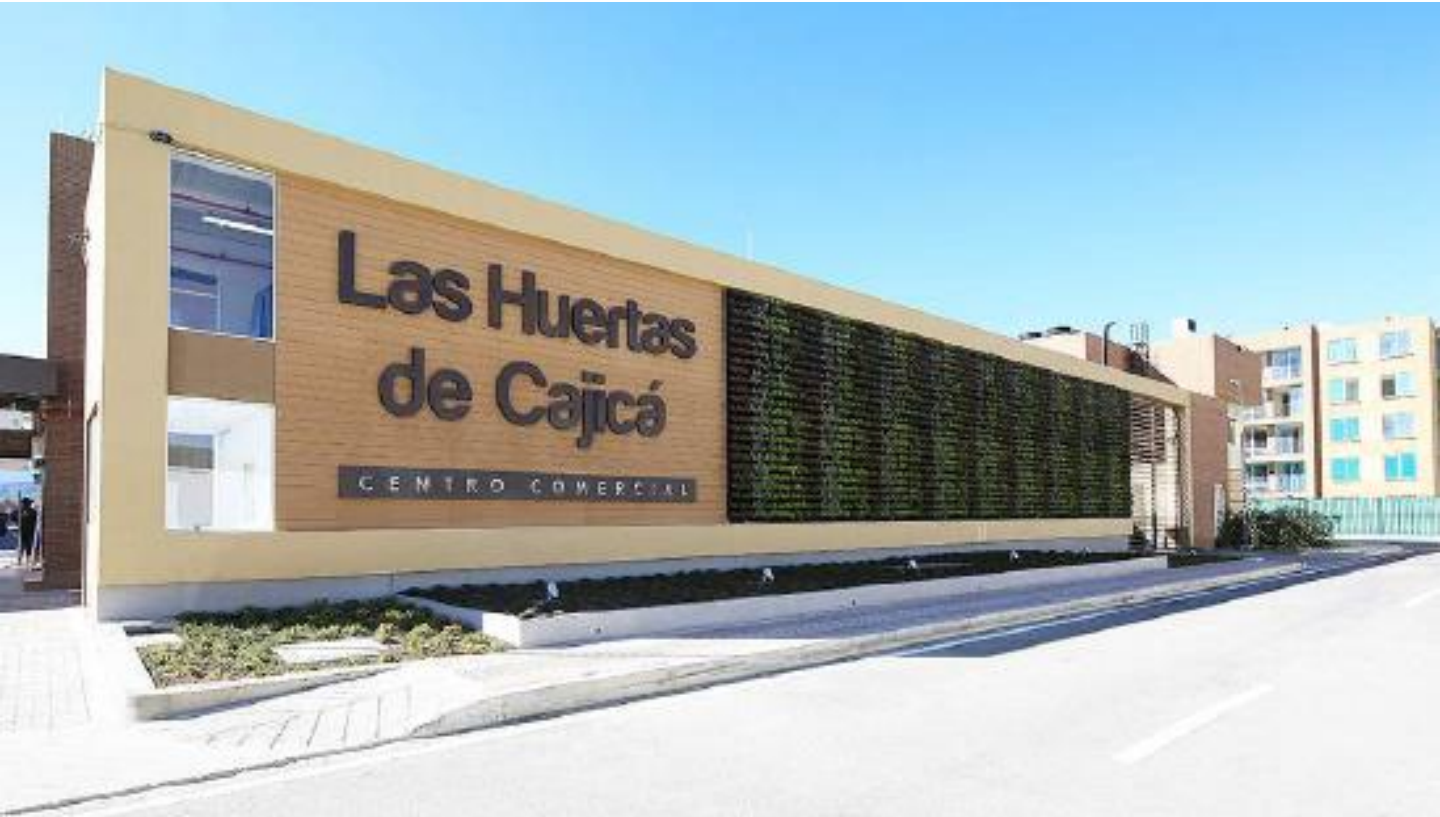
Referencia: WALLBOARD STAR WOOD, Color: Camel Constructora: AMARILO, Proyecto: Centro Comercial Las Huertas de Cajicá, Lugar: Cajicá - C/marca