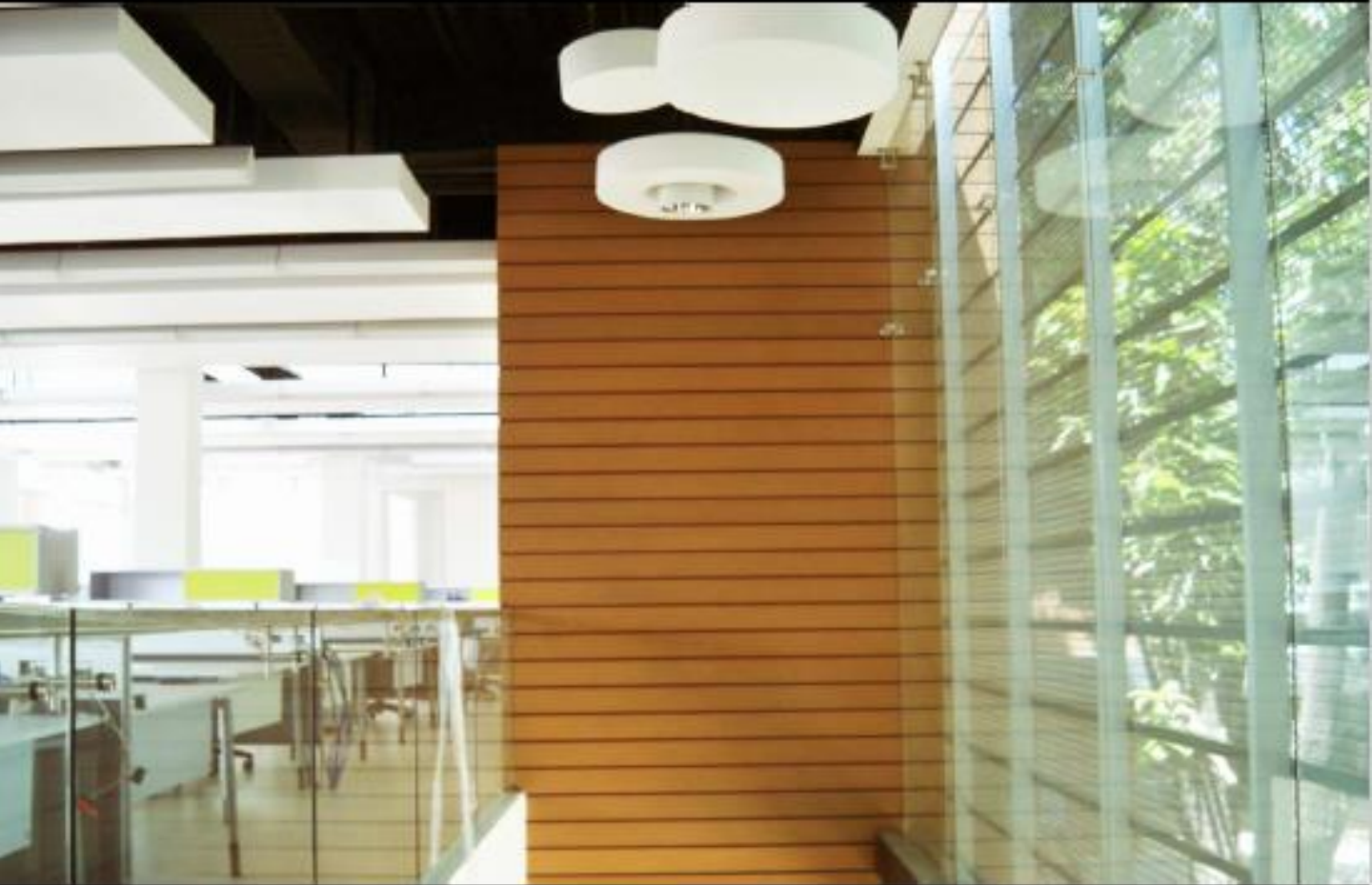
Referencia: WALLBOARD STAR WOOD, Color: Camel Cliente: Arq. Javier Bustamante, Proyecto: Centrales Eléctricas, Lugar: Cúcuta